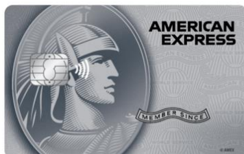
Tarjeta Platinum® American Express® BAC Credomatic