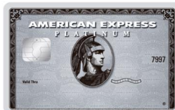
The Platinum Card® American Express® BAC Credomatic

PRIMERO: PROPIEDAD DEL PROGRAMA: El presente programa pertenece en forma exclusiva a BANCO BAC SAN JOSE S.A. , empresa que en adelante se conocerá como BAC CREDOMATIC .